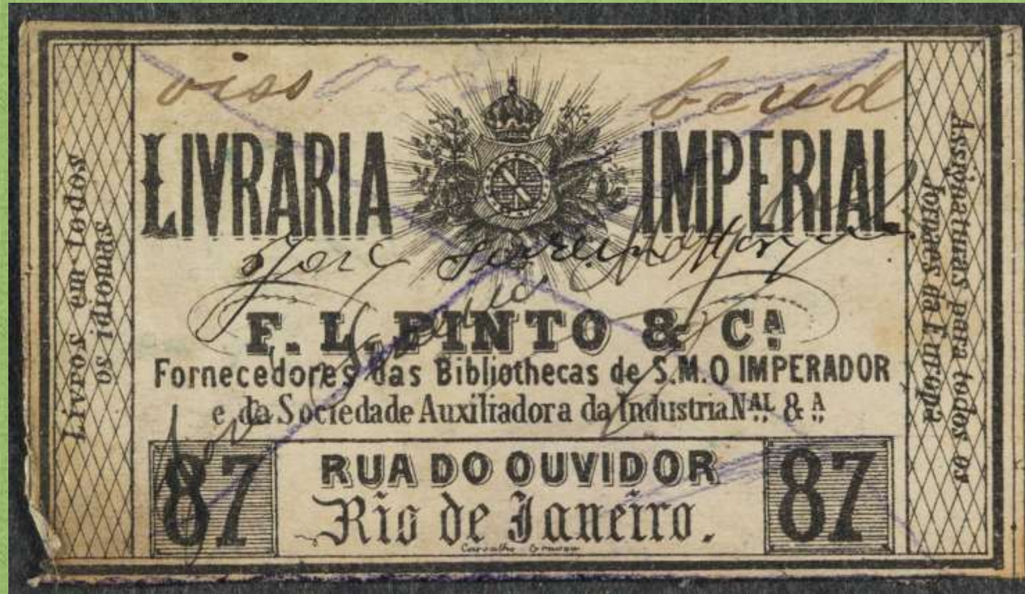
Etiqueta Livraria Imperial

Abordaje bibliográfico y patrimonial desde las marcas de procedencia