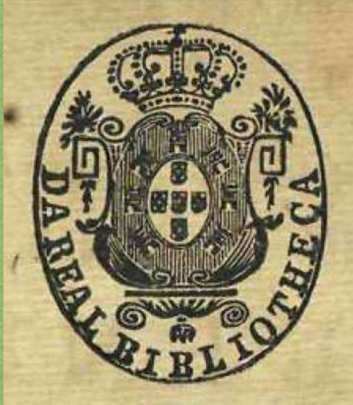
Carimbo “Da Real Bibliotheca” Acervo FBN

Abordaje bibliográfico y patrimonial desde las marcas de procedencia